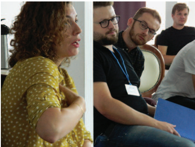
DOX IN VITRO