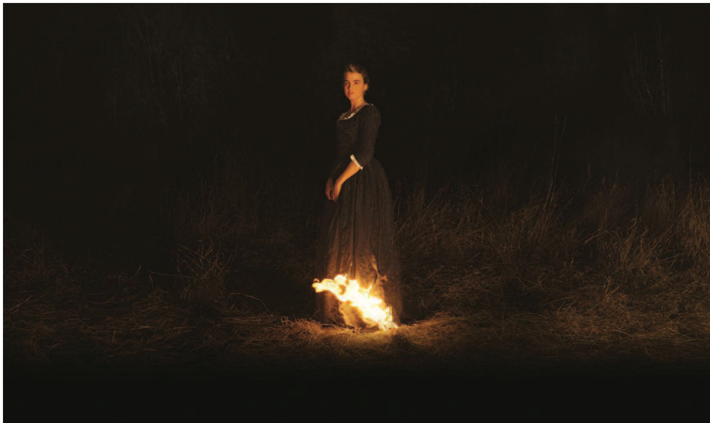
Portrét ženy v plameňoch (r. C. Sciamma, FR, 2019), Výberová podpora kinodistribúcie, ASFK