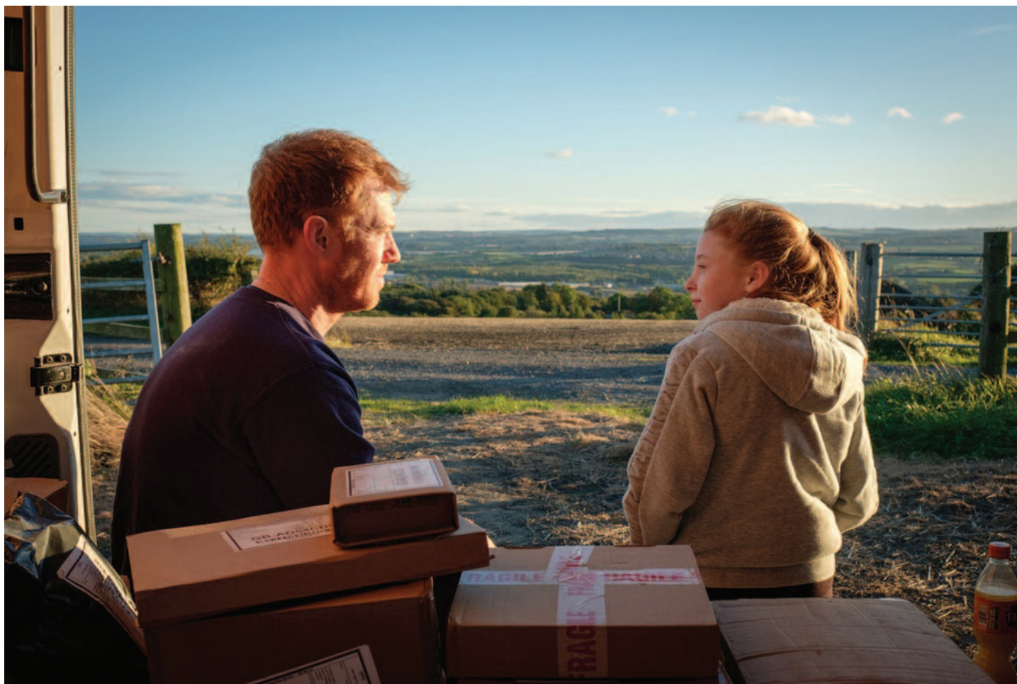
Pardon, nezastihli sme vás (r. K. Loach, GB, FR, BE, 2019), Výberová podpora kinodistribúcie, Film Europe