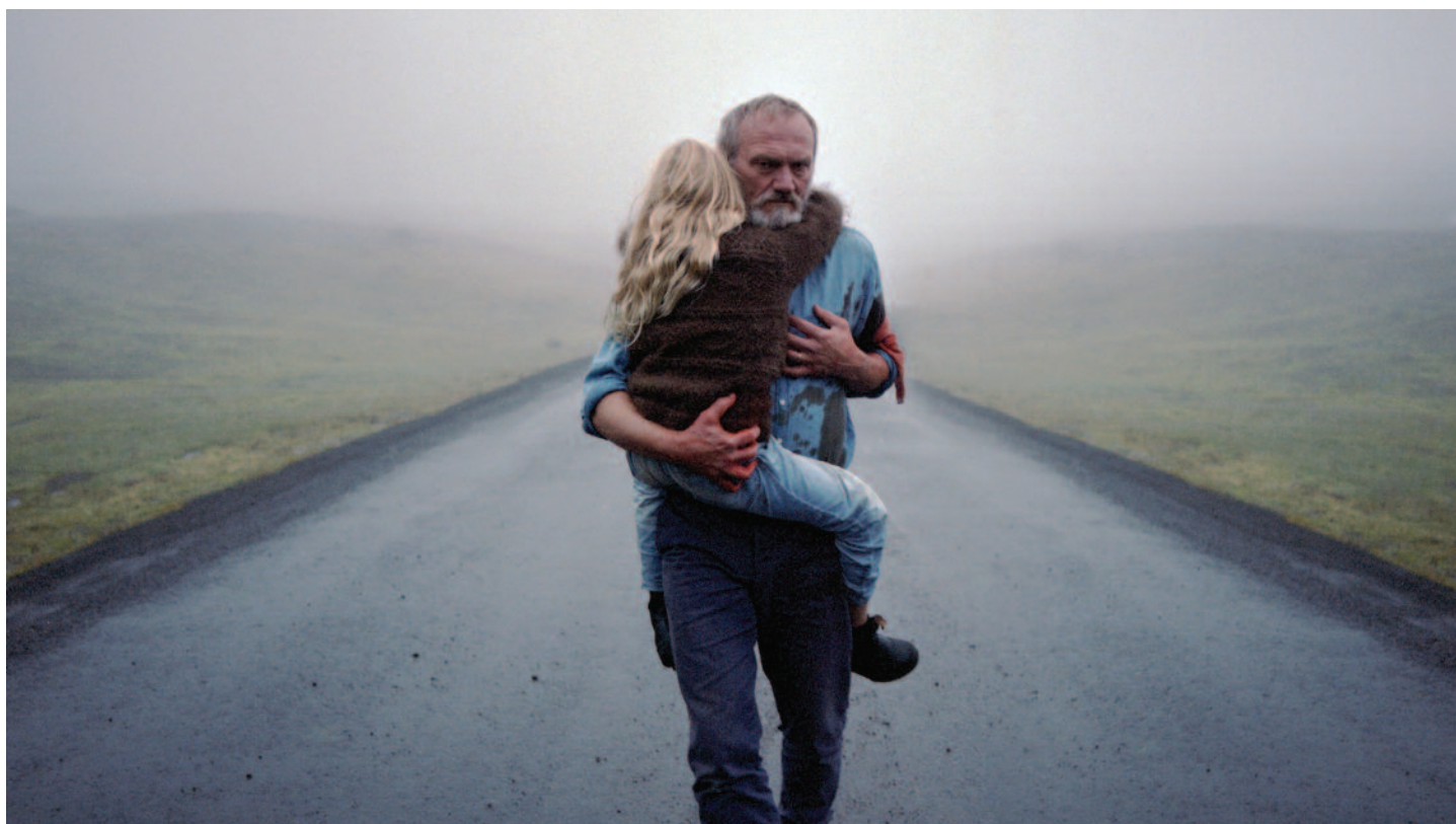
Biely, biely deň (r. H. Palmason, IS, DK, SE, 2019), Výberová podpora kinodistribúcie, ASFK