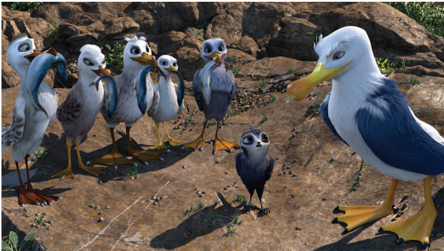
Bleskový Manu (r. C. Haas, A. Block, DE, 2019), Výberová podpora kinodistribúcie, Bontonfilm